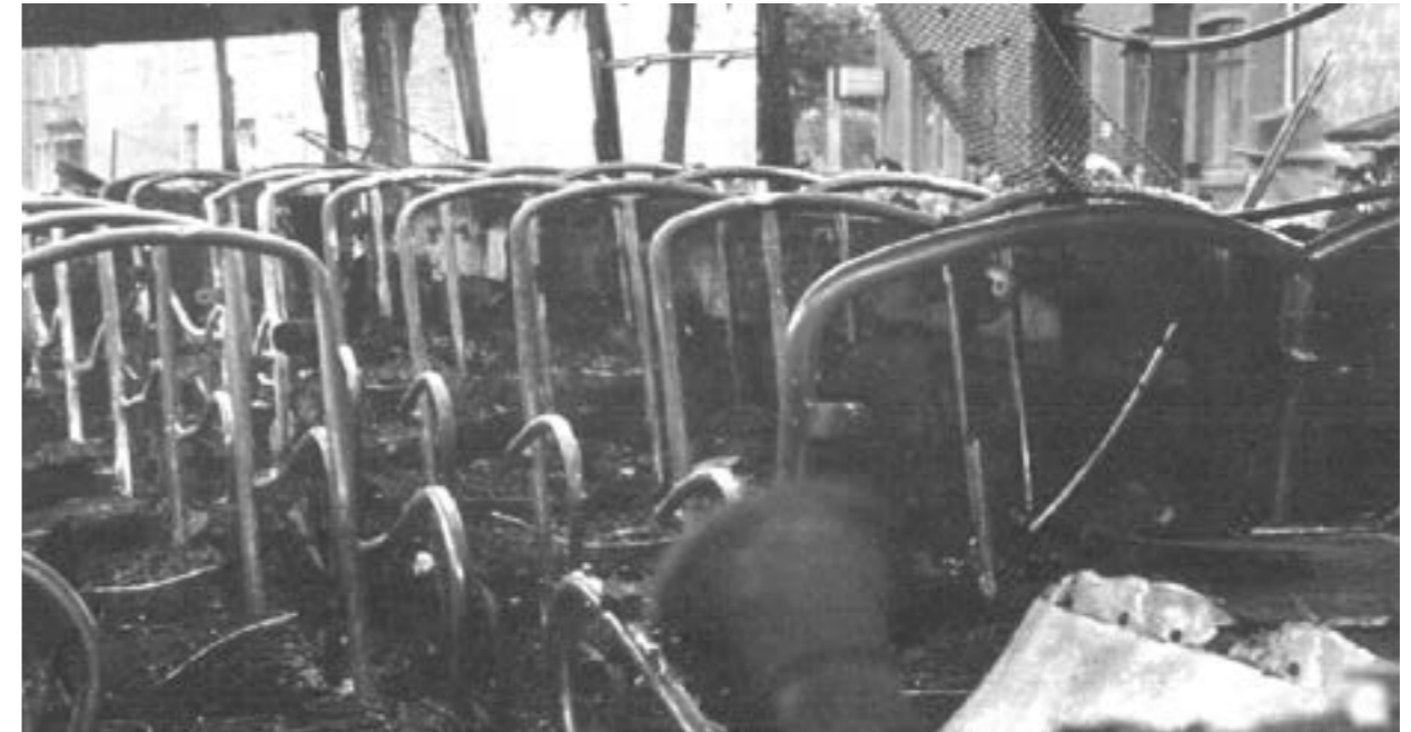
Dit is wat er overbleef van het interieur van de autobus waarmee de kinderen werden vervoerd

De overige inzittenden (24 in getal) kwamen met de schrik vrij en zijn reeds naar huis teruggekeerd. In de toestand van de zwaargewonde kinderen is sinds het ongeluk geen verandering gekomen. Volgens de dienstdoende dokter in het stedelijk ziekenhuis, bevinden zich genoemde vijf kinderen nog steeds in levensgevaar. De toestand van één hunner, een jongen, is zeer ernstig. Over de verdere ontwikkeling van de toestand der patientjes zou naar de mening van de dokter pas over vijf a acht dagen een oordeel mogelijk zijn. De kinderen zijn ondergebracht in het Marien-hospitaal en het stedelijk ziekenhuis.