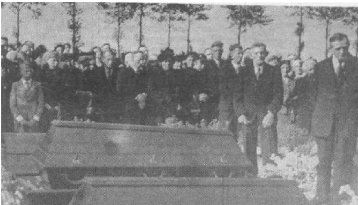
Een grote menigte bracht aan de slachtoffertjes van het autobusongeluk een laatste groet.