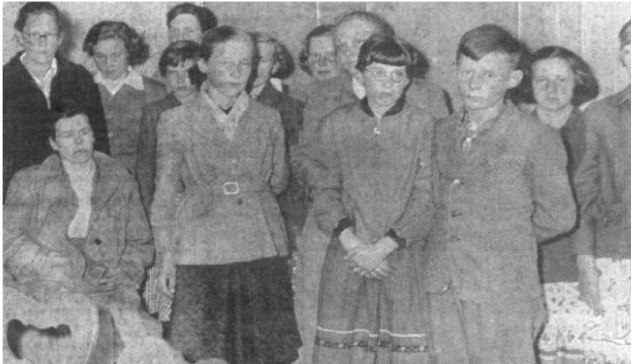
Aan de dood ontsnapt. Verslagen en ontdaan troffen wij dit groepje jongens en meisjes, die geen verwondingen opliepen, in Osnabrück aan.