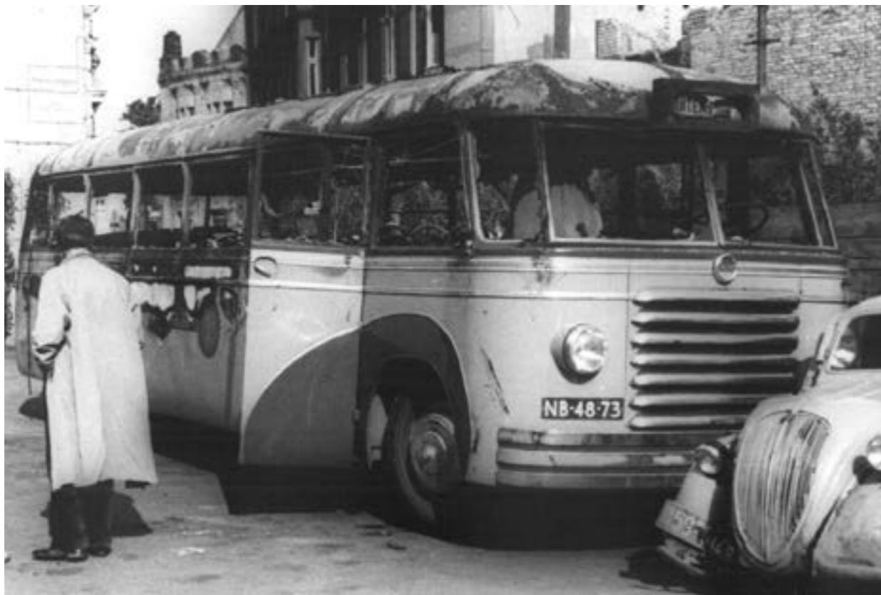
In luttele ogenblikken werd de autobus herschapen in een brandend wrak, waaruit van alle zijden de vlammen lekten. Deze opname toont het restant van het voertuig, nadat het vuur zijn verwoestende arbeid had volbracht.

Even voor de ontploffing hadden bedienden van een benzinestation de bus aangehouden, omdat zij zagen dat deze een rookspoor achterliet. Nadere bijzonderheden ontbreken nog.