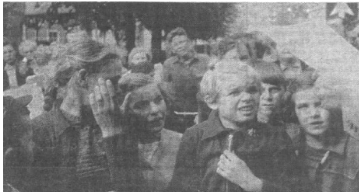
Intense spanning lag op de gezichten der kinderen toen eindelijk de officiële lijst met namen der slachtoffers voor het gemeentehuis werd voorgelezen